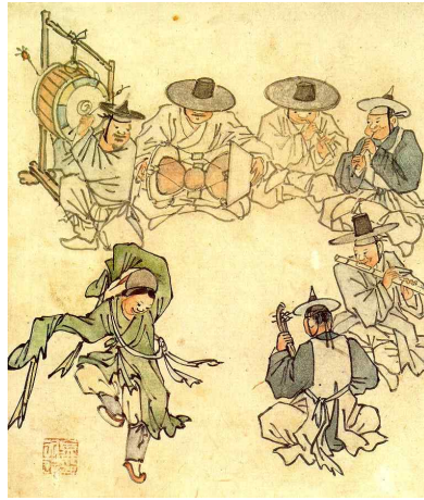
김홍도 〈춤추는 아이〉