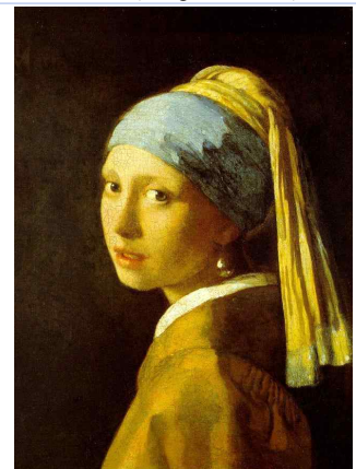
베르메르 〈진주 귀걸이 소녀〉