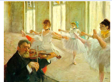
드가 〈무용 교습소〉